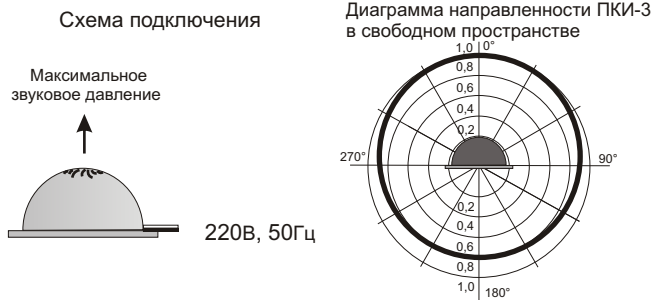
Рис.2 Схема подключения и диаграмма направленности оповещателя ПКИ-3.